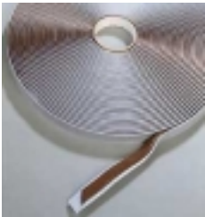
Sigillanti butilici €0

"Sigillanti butilici, poliuretanicri acrilici e silconici"